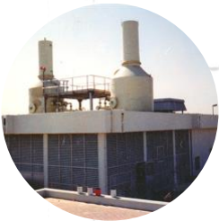
Abluftbehandlung Exhaust air treatment