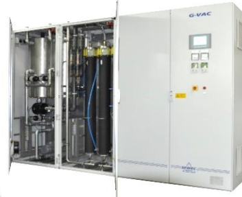
VAC: Unterdruckbetrieb (Vakuum) Negativ Pressure (Vacuum)