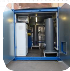
Containeranlagen Container Systems