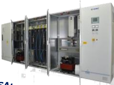
PSA: mit PSA Sauerstoffkonzentrator with PSA Oxygen Concentrator