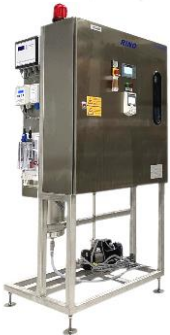
RINO: PSA Kompakt System PSA Compact System