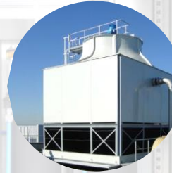
Kühlwasser Cooling water