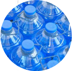
Getränkeindustrie Beverage industry