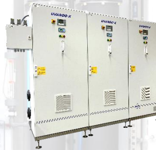
UVANDO: OZON-UV-Anlagen / Ozone UV-Systems