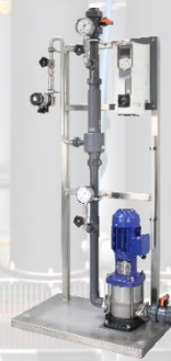
OIS: Ozoninjektionssysteme Ozone Injection Systems