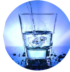
Trinkwasser Drinking water