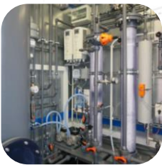
Pilotanlagen Pilot Systems