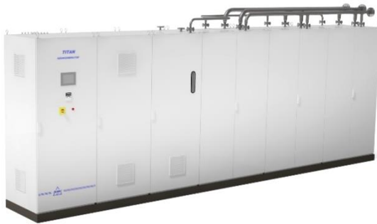
TITAN: 1...20 kgO 3 /hr