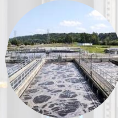
Abwasseraufbereitung Waste water treatment