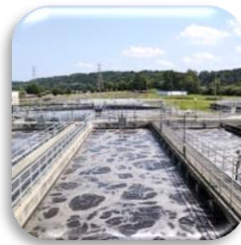
Abwasseraufbereitung Waste water treatment