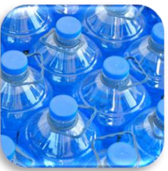
Getränkeindustrie Beverage industry