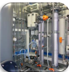
Pilotanlagen Pilot Systems