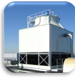
Kühlwasserbehandlung Cooling water treatment