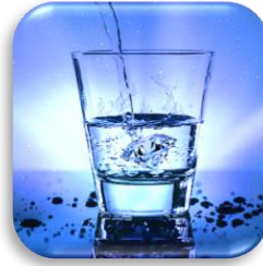
Trinkwasser Drinking water