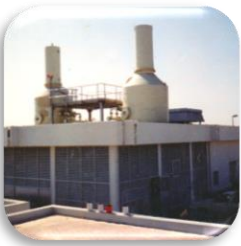
Abluftbehandlung Exhaust air treatment