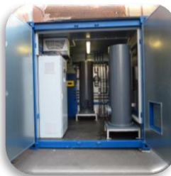
Containeranlagen Container Systems